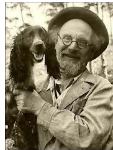
М. М. ПРИШВИН (1873-1954)