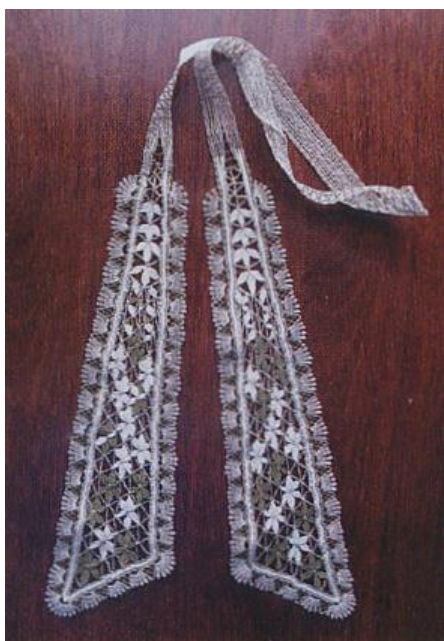
Галстук-бант, 2000 г., армированная нить