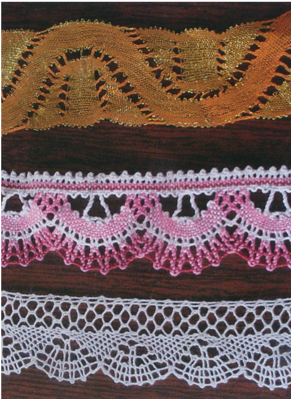
Копия мценского кружева начала XX в.