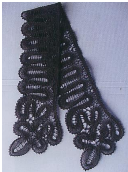
Воротник, 1998 г., 40 см, армированная нить