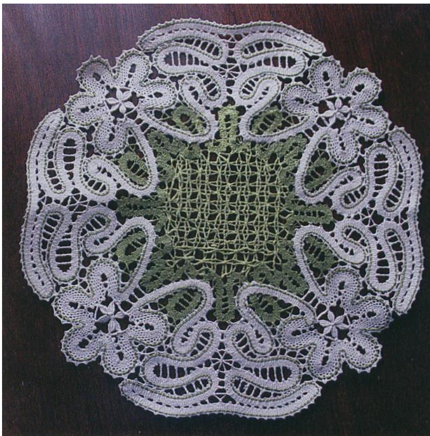
Салфетка, 2011 г., 22 см, х/б