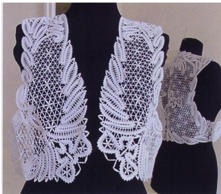
Жилет «Лето», 2010 г., х/б, вискоза

Работы мастера находятся в частных коллекциях.