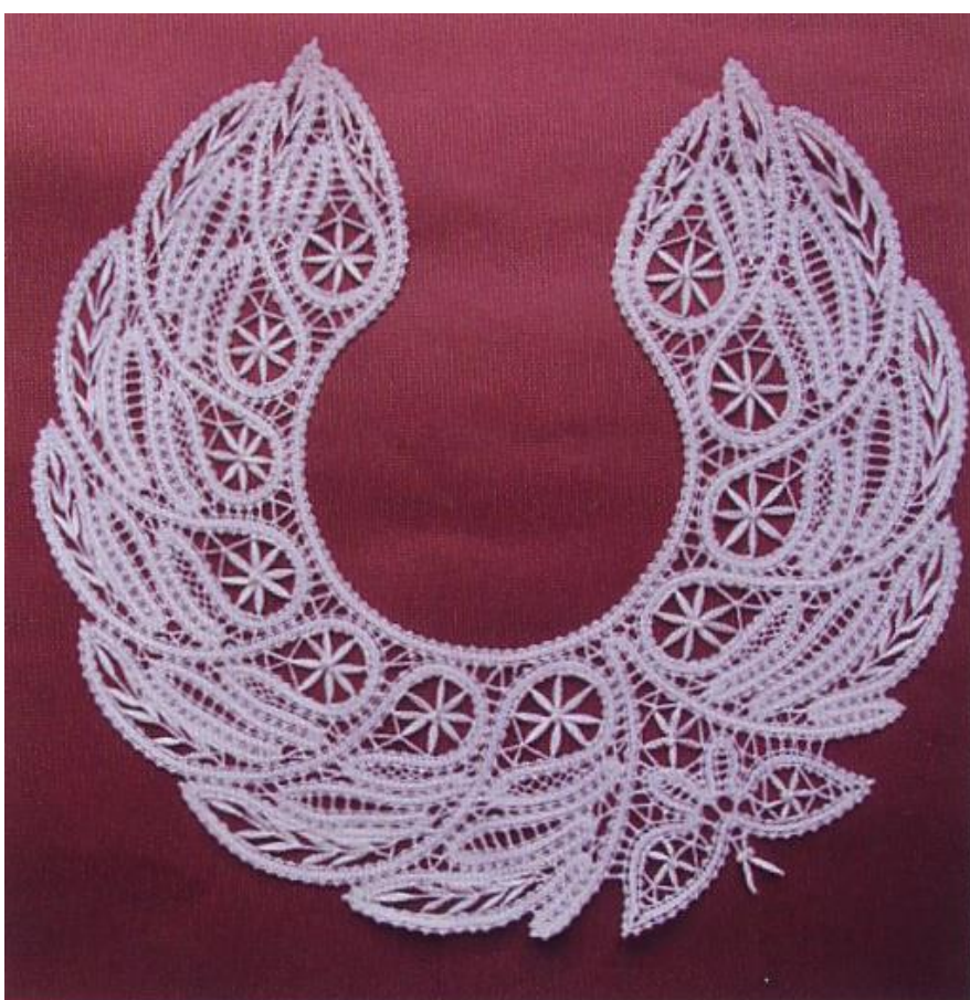
Воротник «Июль», 2008 г., 30 см, х/б, вискоза