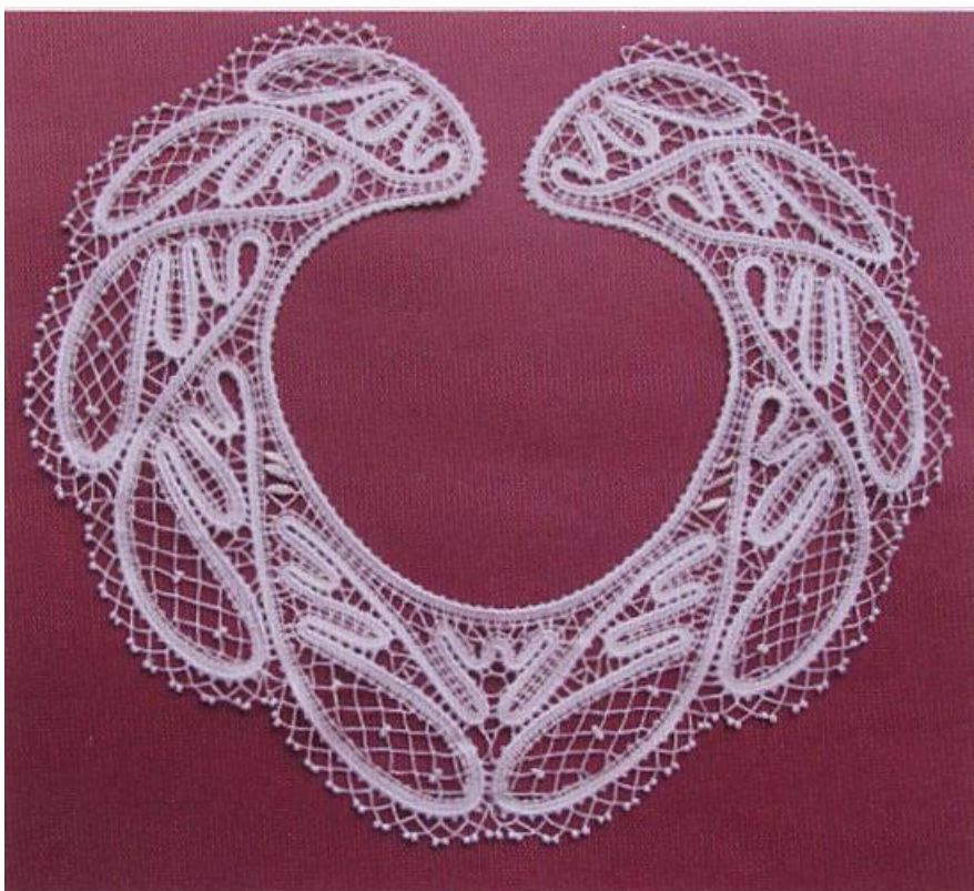
Воротник «Летние росы», 2006 г., 27 см, армированная нить